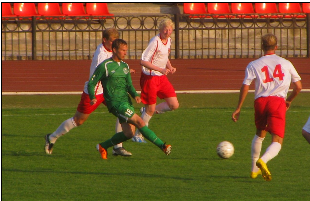
В августовском поединке ельчане сыграли с «Арсеналом» рационально и добились победы