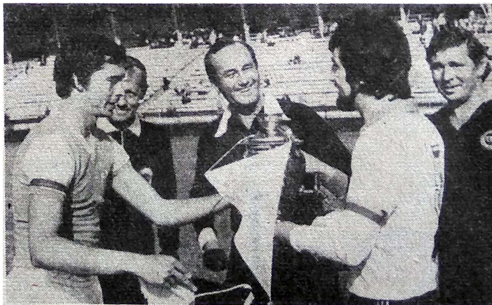
18.03.81. ТОЗ — «Сен-Жан-Бонфон». Перед началом матча.